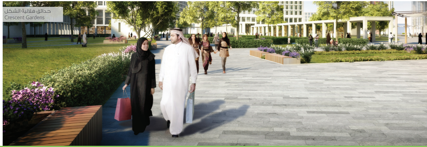
حدائق هلالية الشكل Crescent Gardens