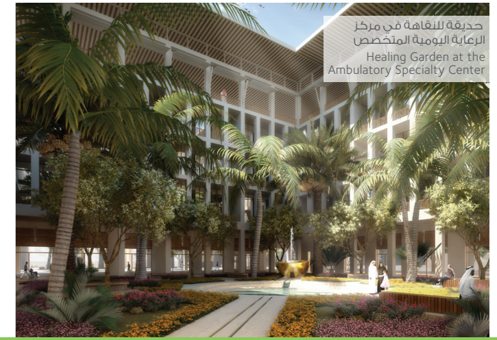
حديقة للشفاء في مركز الرعاية اليومية المتخصص Healing Garden at the Ambulatory Speciality Center