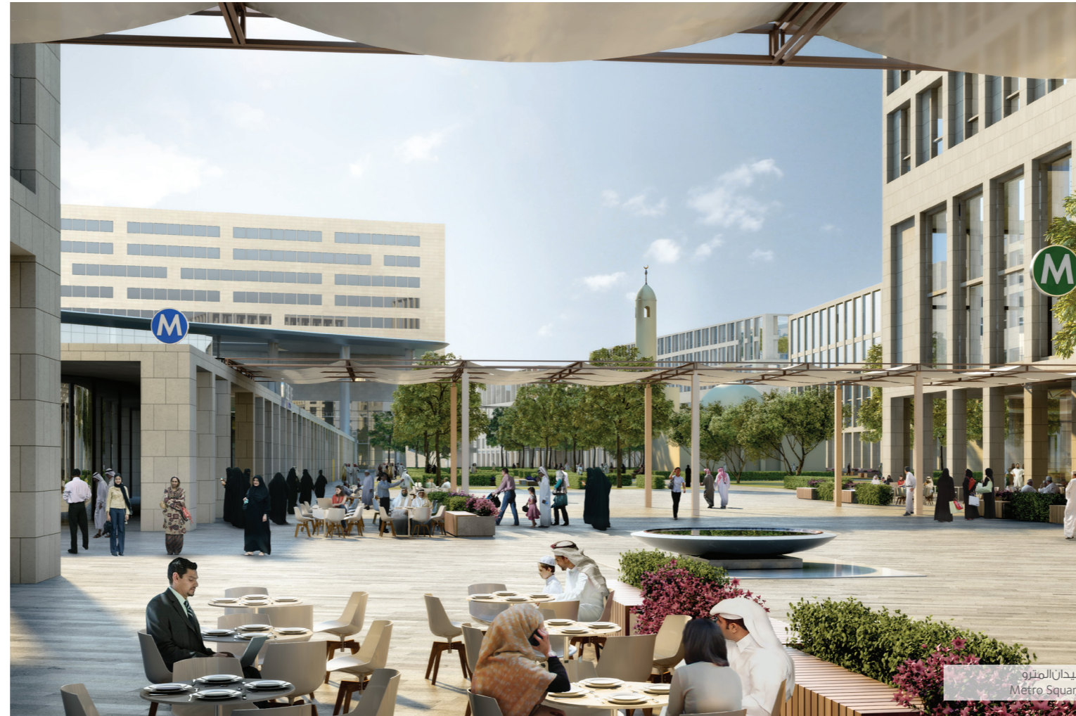
ميدان المترو Metro Square