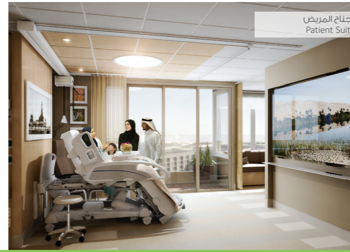
جناح المريض Patient Suite