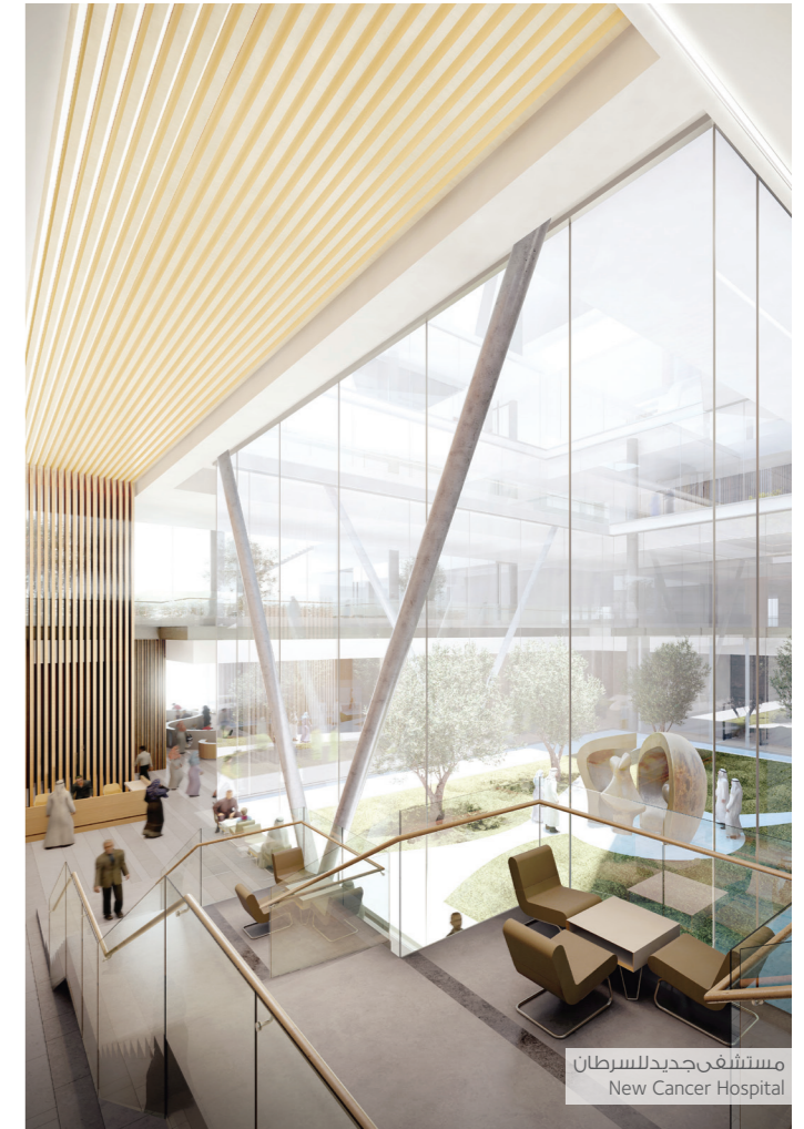
مستشفى جديد للسرطان New Cancer Hospital