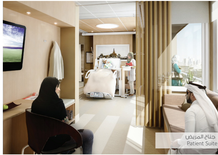
جناح المريض Patient Suite